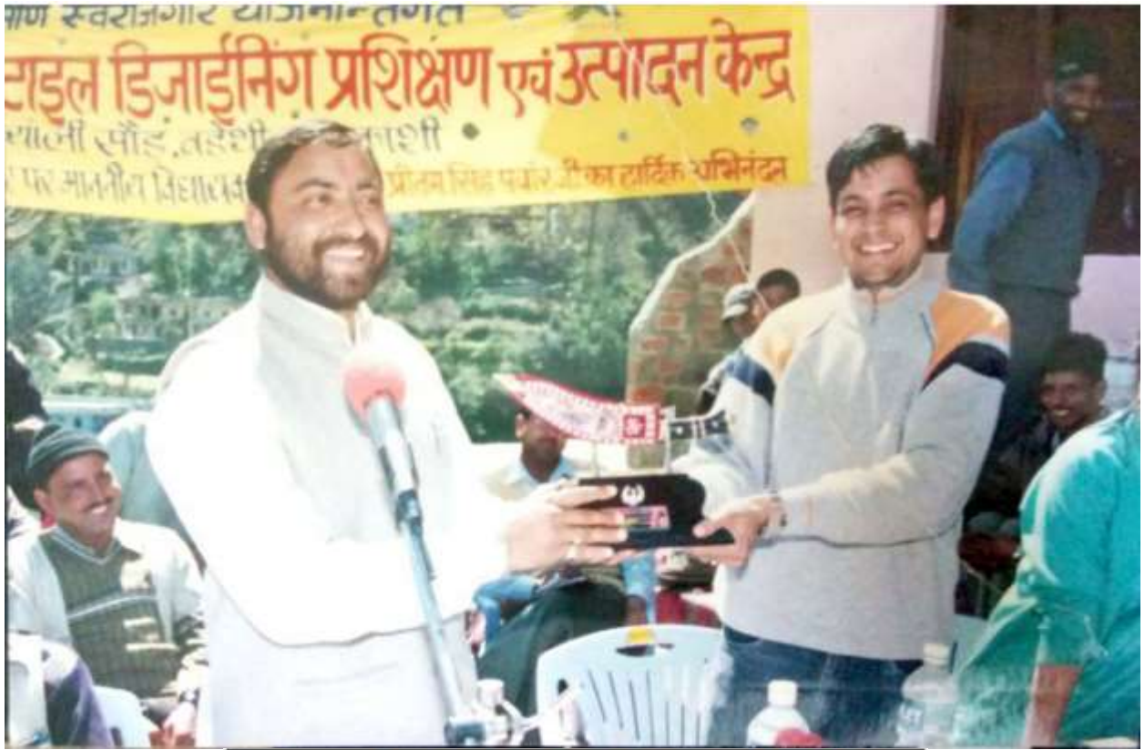
TROPY FROM LOCAL MLA, UTTARKASHI 2005 FOR CENTRE FOR EXCELLENCE