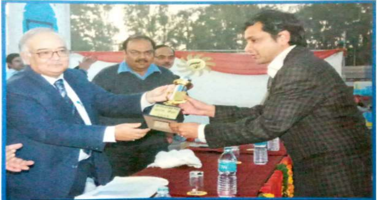
TROPY FROM CHIEF SECRETARY, UTTARAKHAND FOR SARAS EVENT IN 2011

Saras was managed by DRES for the Uttarakhand Government, consecutively for ten years! It is the largest platform in the state for rural artisans & SHGS, jointly sponsored by Ministry of Rural Development & Rural Development Department, Uttarakhand. DRES has been awarded several trophies for Best Event Manager for managing Uttarakhand Saras Mahotsavas.